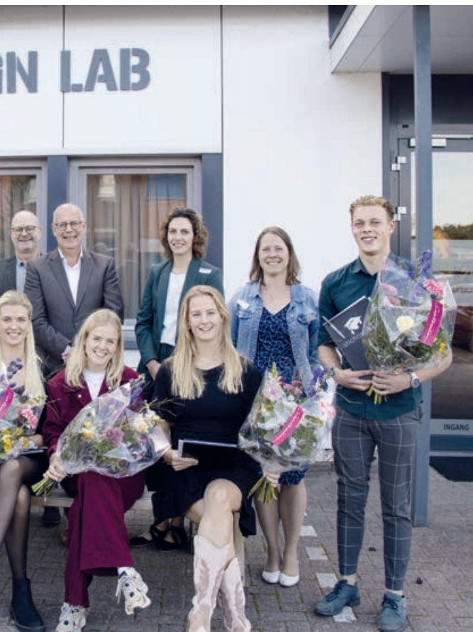
Al jaren maakt de Stichting Bevordering Studie Diervoeding het mogelijk om jong talent in de diervoedersector (financieel) te ondersteunen.

specifieke manier inzetten: als docent. “De leukste docenten zijn degenen met praktijkervaring. Daarom wil ik dat opdoen.”